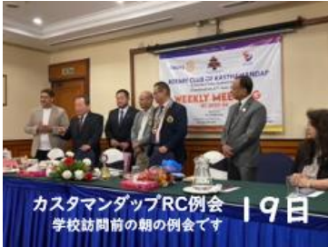
カスタマダップRC例会 学校訪問前の朝の例会です 19日