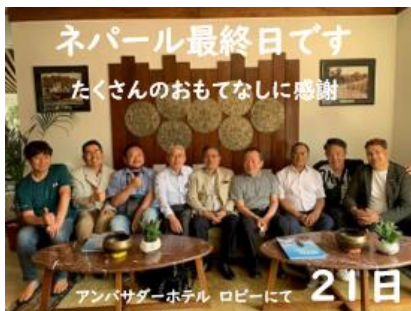
ネパール最終日です たくさんのおもてなしに感謝