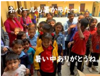
ネパールも暑かった～！ 暑い中ありがとうね。