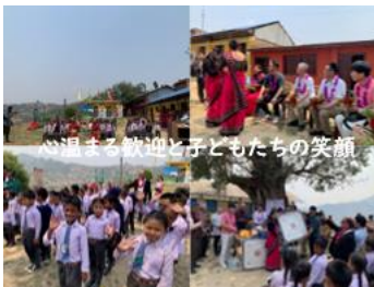
心温まる歓迎と子どもたちの笑顔