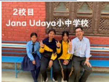
2校目 Jana Udaya小中学校