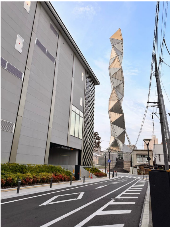
市民会館の横には磯崎新による水戸芸術館が並び、水戸は建築ファンにはたまらない街になってきました。