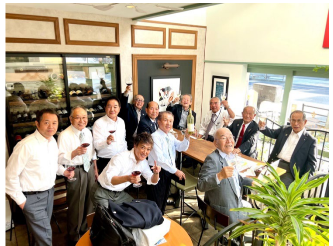
終了後の打ち上げ