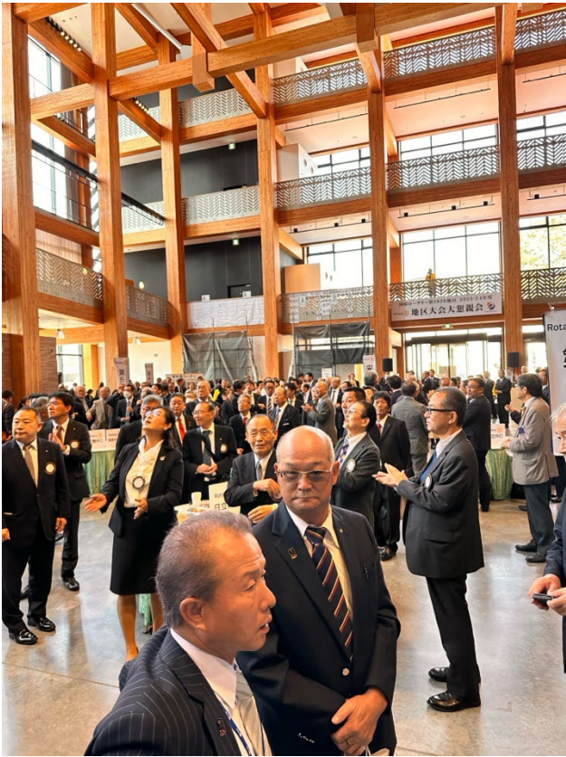
本会議後の大懇親会は市民会館内の「やぐら広場」にて。木造建築による4階吹き抜け構造を実現した圧巻の空間。