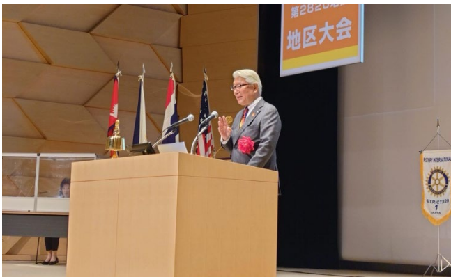
檜畑直尚 RI 会長代理による挨拶