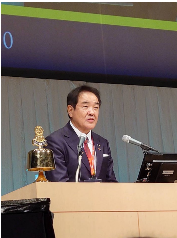
我らが大高司郎ガバナーエレクトによる挨拶