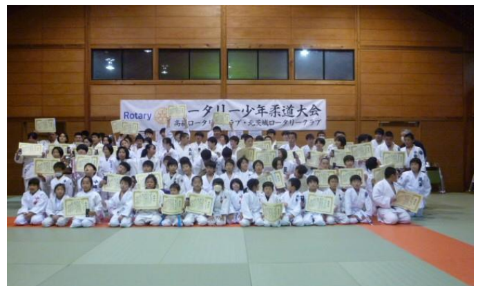
閉会式終了後、参加選手の記念写真