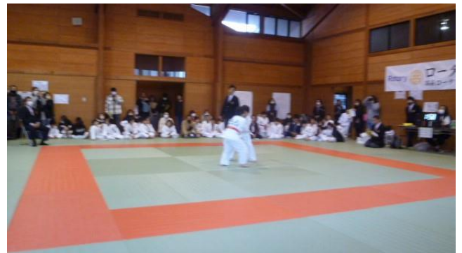
少年団選手(小学生)の熱戦