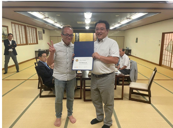
<久保田会員の授賞式がありました。>