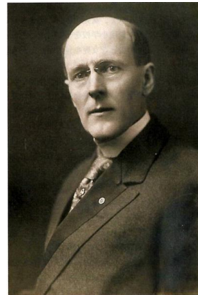
ロータリーの創始者、ポールP.ハリス(撮影:1915年頃)

○世界理解と国際奉仕 茨城県域のロータリークラブである第2820地区は、次の3地区と友好地区として、親睦、交流、友好を深め、奉仕活動を実施している