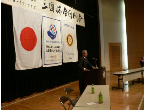
高萩LC 高萩JC 高萩RC 3団体合同例会 講演資料