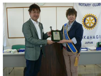
← 職業奉仕功労賞 「英語スピーチコンテスト」が受賞