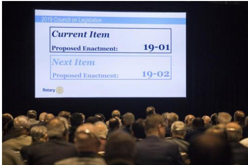
【写真】シカゴで開かれた 2019 年規定審議会で制案の投票を行う代表議員。

会員数が 6 名未満となったクラブは、ガバナーの要請により理事会がそのクラブを終結させることができるとする。