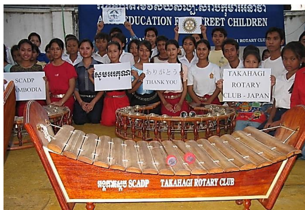
(音楽プロジェクトで民族楽器を支援)

高萩ロータリークラブの長年にわたるストリートチルドレン支援活動が評価され、2012 年にカンボジア政府から、「感謝状」と「ゴールドメダル」が授与されました。