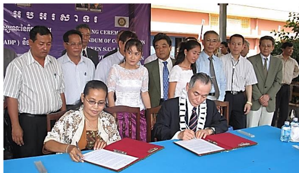
(現地の NGO 団体 SCADP と 支援について協定書を締結)

最初の 3 年間は「音楽プロジェクト」で楽器を贈り、2007 年から 6 年間は「就学プログラム」で 250 名の子供たちが学校に通えるよう資金を支援してきました。