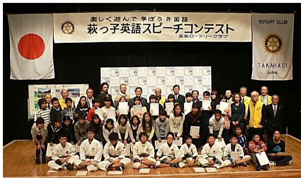
(参加者、審査委員、ロータリアン全員で)